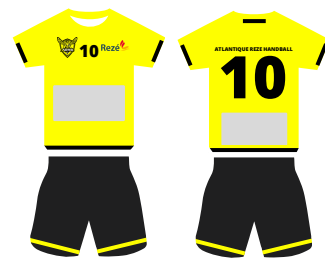
maillots équipes départementales et jeunes