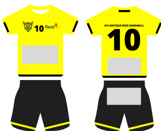
maillots équipes régionales et espoirs