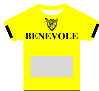
tee-shirts des bénévoles (X20)