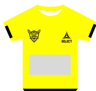
polo staff (X20)

Pour nous contacter : partenariat.arhb@gmail.com / 06 95 21 98 70