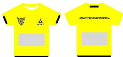
maillots d'échauffement pour une équipe