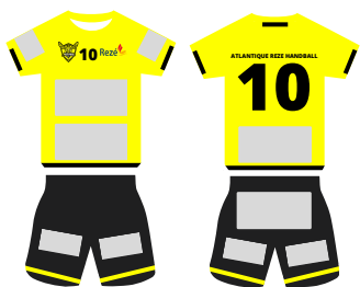
maillots équipes prénationales/nationales